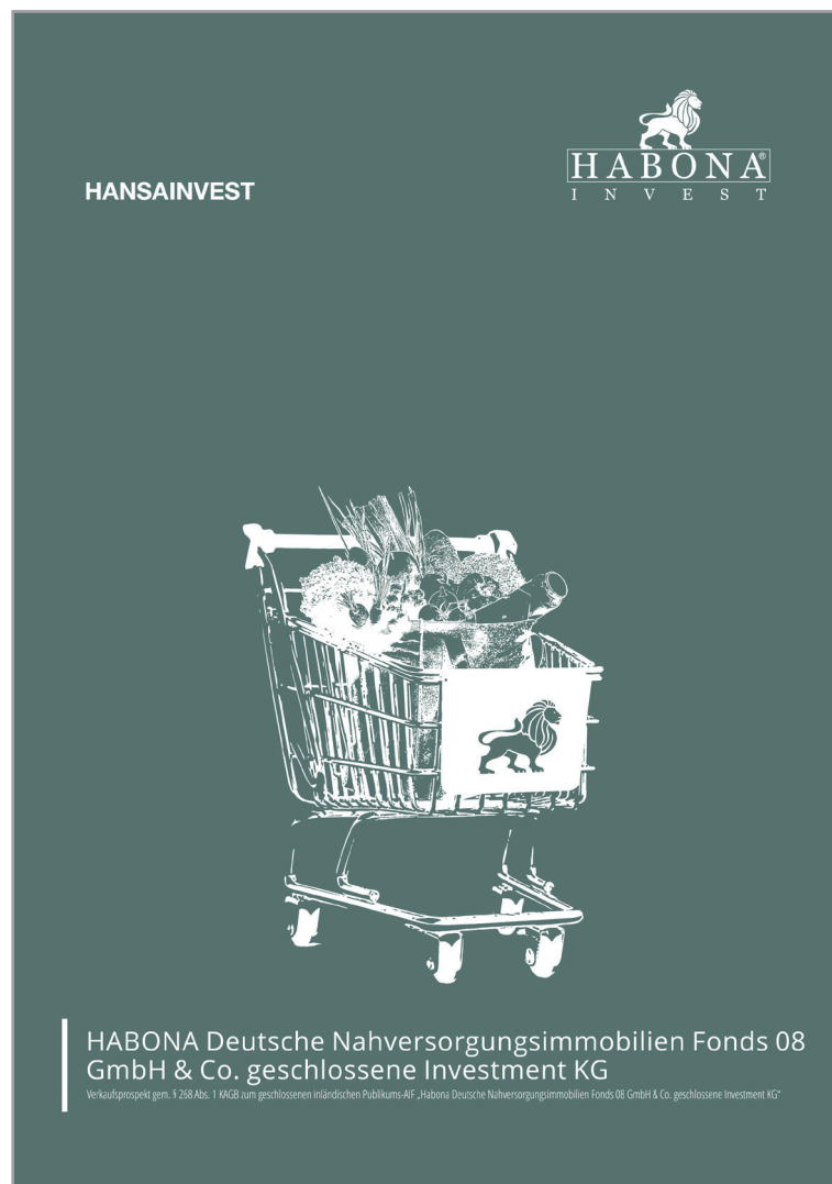
Abbildung: Titelseite des Verkaufsprospekts