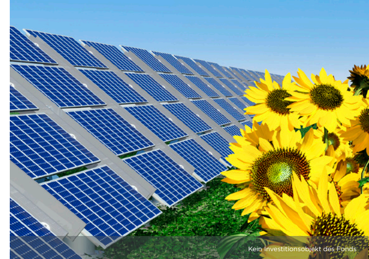
Kein Investitionsobjekt des Fonds

Prognostizierte Gesamtausschüttung von 145 % , bei einer Laufzeit von 10 Jahren