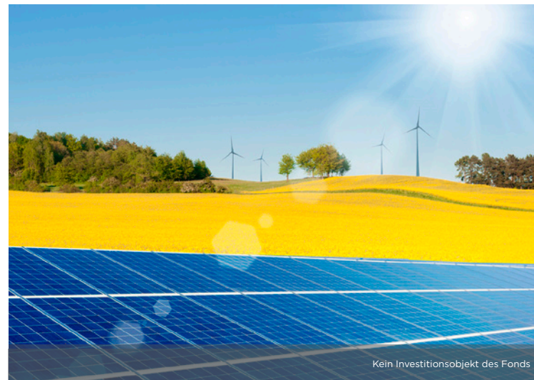
Kein Investitionsobjekt des Fonds