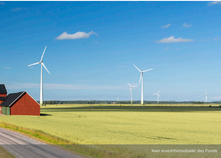
Kein Investitionsobjekt des Fonds

Insgesamt wurden durch Wind- und Solarparks der EURAMCO Gruppe rund 3 Millionen MWh Strom erzeugt und 1,6 Millionen Tonnen CO 2 -Emissionen vermieden: