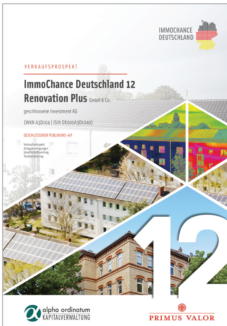
Abbildung: Titelseite der Verkaufsprospekts