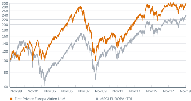
Wertentwicklung des First Private Europa Aktien ULM seit Auflegung im Vergleich zum MSCI Europe (Total Return Index). Berechnung der Wertentwicklung nach BVI-Methode, d.h. ohne Berücksichtigung des Ausgabeaufschlages. Wertentwicklungen in der Vergangenheit sind kein verlässlicher Indikator für die zukünftige Wertentwicklung.